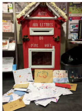
La boîte du Père Noël de Vauhallan

Bravo à tous les petits Vauhallanais qui ont envoyé leurs souhaits de