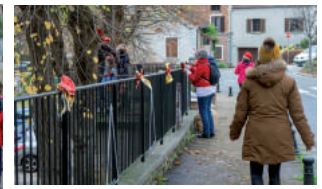
Les bénévoles décorent la Place du village