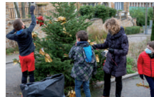
Sapin décoré par le CMJ

« D écidée à faire briller l'esprit des fêtes de fin d'année, la Municipalité de Vauhallan a invité ses habitants à faire scintiller leur quartier en habillant maisons, jardins et balcons aux couleurs de Noël. »