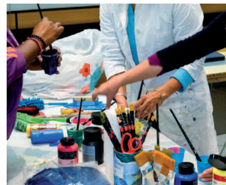
Atelier peinture à Handispensable

les participants à des ateliers : danse, modelage, peinture, et découverte de l'« écriture facilitée », une méthode offrant un espace d'expression à des personnes ne pouvant s'exprimer par la parole. Un événement à renouveler !