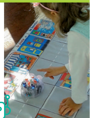
Atelier Blue Bot

Cette manifestation était également soutenue par la Communauté d'Agglomération Paris-Saclay.