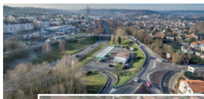
Le Ring du Pileu

D u 28 septembre au 30 octobre, le réaménagement du Ring du Pileu (situé à l'extrémité ouest de la commune de Massy, à proximité immédiate des communes d'Igny et Palaiseau) est soumis à une concertation publique. L'objectif du réaménagement consiste à sécuriser et organiser les différents modes de déplacements.