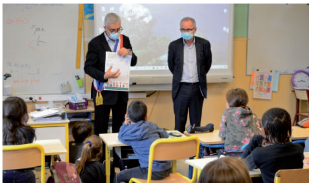
Présentation du C.M.J.

)) Jusqu'au 3 novembre, les enfants de CM1 sont invités à déposer leur candidature en mairie ainsi que l'affiche (profession de foi) remise en classe qu'ils auront pris le temps de compléter. Les candidats seront amenés à se présenter le 9 novembre devant l'ensemble des élèves de l'école afin d'exposer leurs envies et motivations pour représenter leurs camarades au sein du CMJ. Les élections auront lieu le jeudi 12 novembre. Les résultats seront annoncés le lendemain à tous les élèves de l'école.