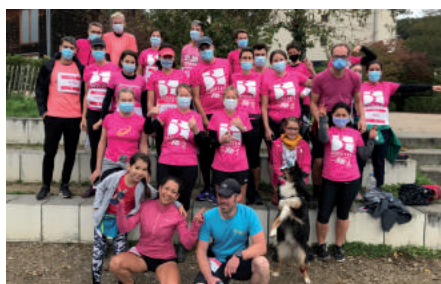
L'équipe « octobre rose » de Vauhallan