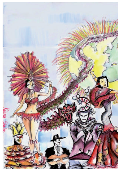
Dessin de l'affiche 2023, réalisé par Kiana SHATER

CARNAVAL DE VAUHALLAN : samedi 18 mars 2023 à 14h30