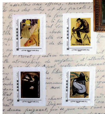
Timbres en vente à l'abbaye