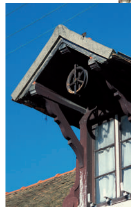
Lucarne à foin