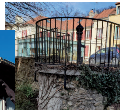
Pompe à eau