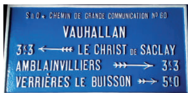
Plaque de cocher

Rendez-vous devant le Syndicat d'Initiative de Vauhallan le samedi 24 juin à 14h.