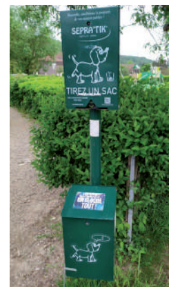
Distributeur de sacs, allée des Écoles