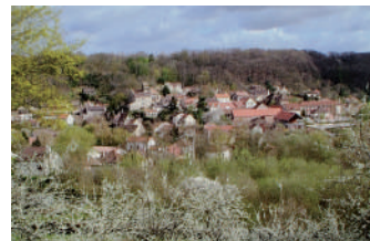
Village vu de Limon - © JDG 2005

Un siècle plus tard, voici pratiquement la même vue prise par Jacques DE GIVRY, célèbre photographe de la Vallée de la Bièvre et du plateau de Saclay, exposée dans la salle du conseil municipal et dans son ouvrage « Plateau de Saclay - Racines d'avenir* ».