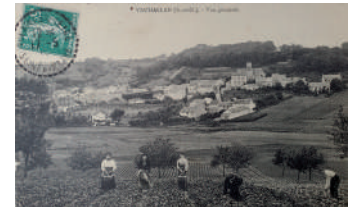
Vue générale 1910. Collection Syndicat d'Initiative

Les Vauhallanais ont reçu dans leurs boîtes aux lettres une publicité avec la reproduction d'une carte postale (voir ci-contre) datant des années 1910.