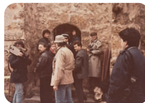
Tournage de « Sauve-toi Lola »