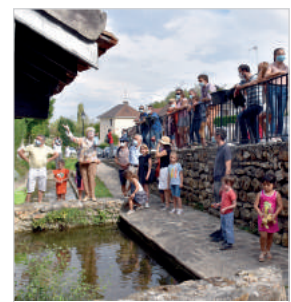
Accueil des nouveaux Vauhallanais 2020

Moment de découverte du village et d'échange avec les élus. Les nouveaux Vauhallanais sont conviés par la municipalité à une visite commentée de la commune par le Syndicat d'Initiative et du Jardin de Cocagne de Limon de 14h à 17h. Un panier fraîcheur leur sera offert par la municipalité !