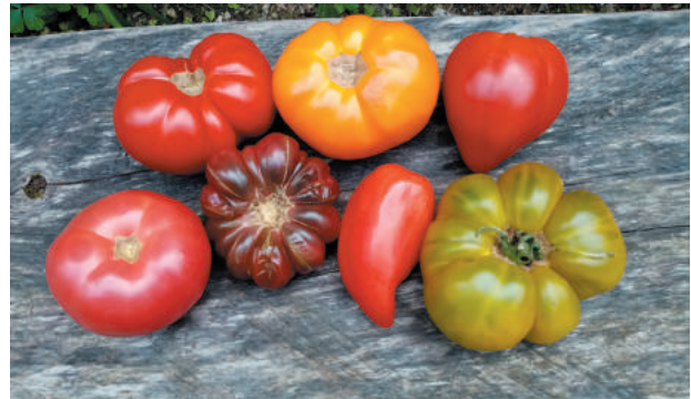
Tomates anciennes de Cocagne, de haut en bas dans le sens des aiguilles d'une montre : Marmande- Orange Queen- Cœur de bœuf- Evergreen- Andine cornue- Purple Calabash- Rose de Berne.

Grâce à ses recherches d'« Histoires Gourmandes en Essonne », le Syndicat d'Initiative a retrouvé