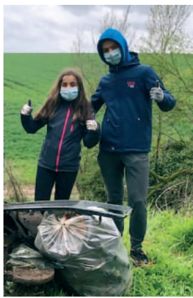
De nombreux déchets ont été collectés

Prendre conscience que notre devoir de citoyen commence par le respect de notre environnement le plus proche est l'un des objectifs du CMJ. La quantité de déchets ramassés pendant cette journée nous a montré le chemin qui nous reste à parcourir collectivement. A ce titre, la municipalité salue également la