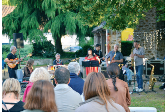
La Fête de la musique 2019 à Vauhallan

Pour participer , il vous suffit de vous inscrire auprès du service animation de la mairie avant le lundi 17 mai 2021 à communication@vauhallan.fr en précisant : nom du musicien/groupe, email, numéro de téléphone, nombre de musiciens, style musical, musique acoustique ou amplifiée en autonomie.