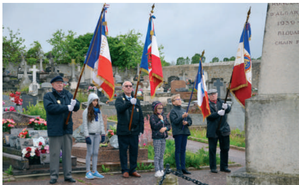
Commémoration du 8 mai 2019

En attendant, pour en savoir plus sur le label : https://www.paris2024.org/fr/label-terre-de-jeux-2024/