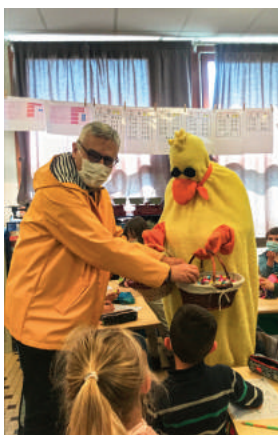
Distribution de chocolats par M. le Maire et « Cui-Cui »

Ce fut un moment chaleureux, autant apprécié par les adultes que les enfants !