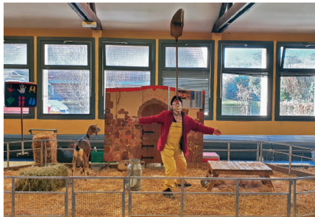
La ferme Tiligolo

Vendredi 12 mars 2021, l'école maternelle des Sablons a reçu la visite de la ferme Tiligolo, une ferme itinérante.