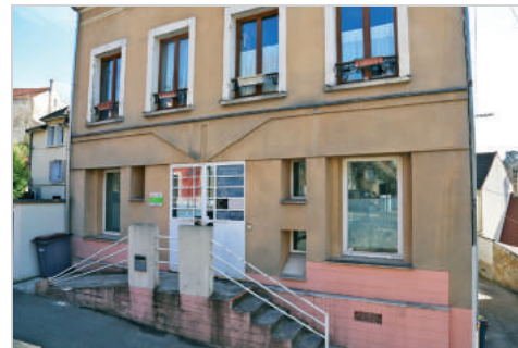
Cabinet médical le Village