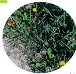
Pissenlit de Vauhallan

La fleur jaune composée, capitule, est faite de nombreuses fleurs ligulées (souvent prises pour des pétales), qui forment ensuite des akènes (fruit sec) surmontées d'une aigrette lui permettant de s'envoler, avec à la base une minuscule graine. Le pissenlit, dont la culture fut développée en Ile-de-France avec les sélections Vilmorin Vert de Montmagny amélioré , amélioré à cœur plein , peut faire partie du