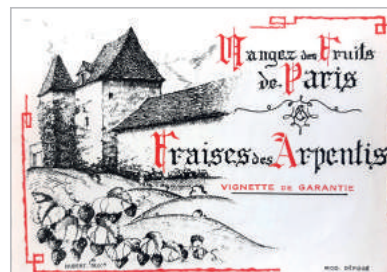
Etiquette Fraises des Arpentis sur la Plaine

La pénibilité du travail entièrement manuel a sonné l'arrêt de la culture de la fraise.