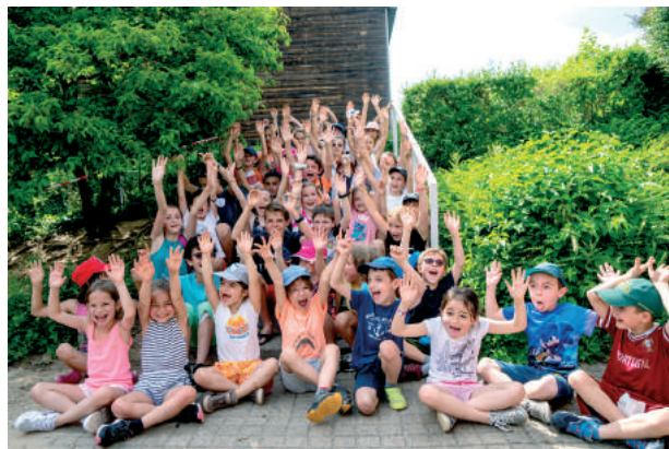
Les enfants participants à la course