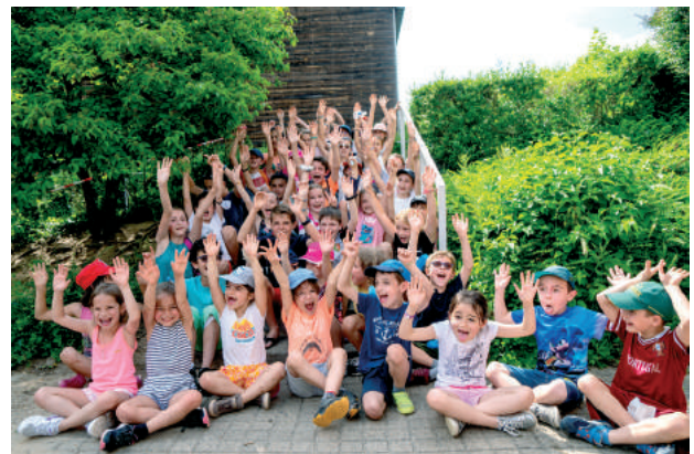
Les enfants participants à la course