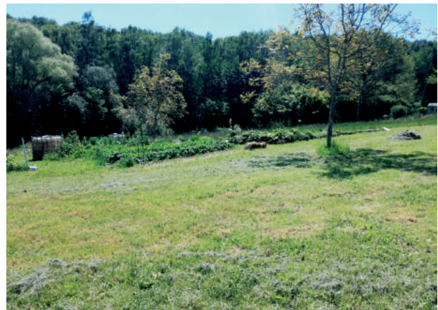
Le Jardin des caves tondu