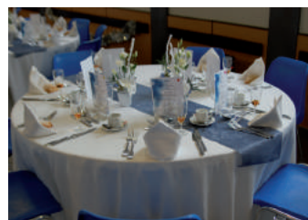
Banquet des aînés 2019

Les plus de 80 ans, absents au banquet des aînés, pourront bénéficier d'un colis de Noël gourmand (sur demande).