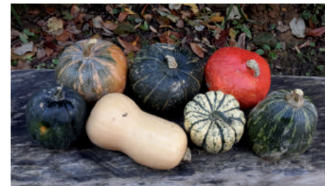
De haut en bas dans le sens des aiguilles d'une montre : Musquée de Provence - Potimarron vert - Potimarron orange - Giraumon antillais - Patidou - Butternut - Acorn.

*Document du SI Vauhallan : Halloween, pure tradition celtique.