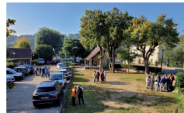
Place du Général Leclerc à Vauhallan

Afin d'enrichir les scénarios qui seront soumis à la concertation, la Municipalité a décidé de reporter à une date ultérieure l'atelier prévu initialement le samedi 4 décembre 2021.