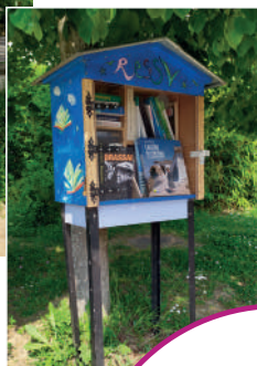
La boîte à livres réparée