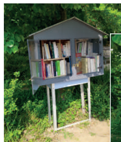
La boîte à livres neuve

* Le Réseau d'Echanges de Savoir et de Service de Vauhallan (RESSV)