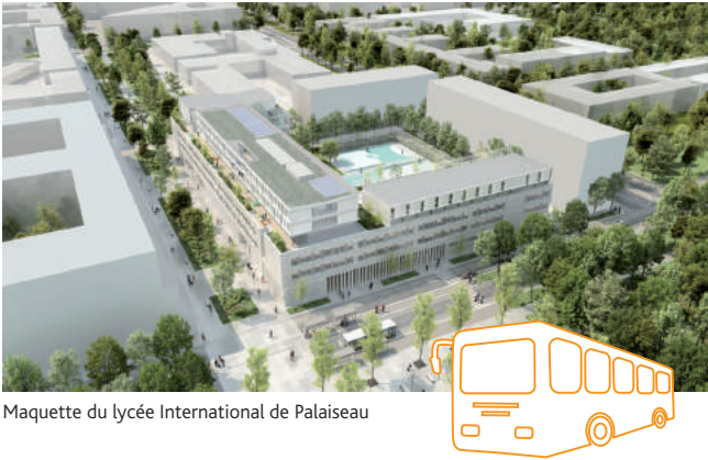
Maquette du lycée International de Palaiseau