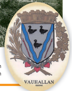
Blason de Vauhallan