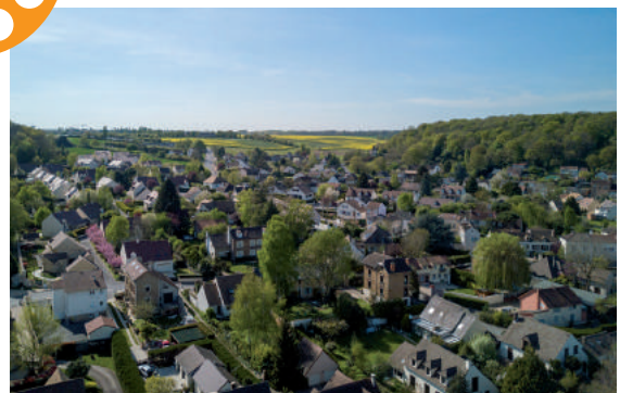
Village de Vauhallan

Pour en savoir plus sur les référents de quartier, rendez-vous sur vauhallan.fr , onglet « Cadre de vie », « Référents de quartier ».